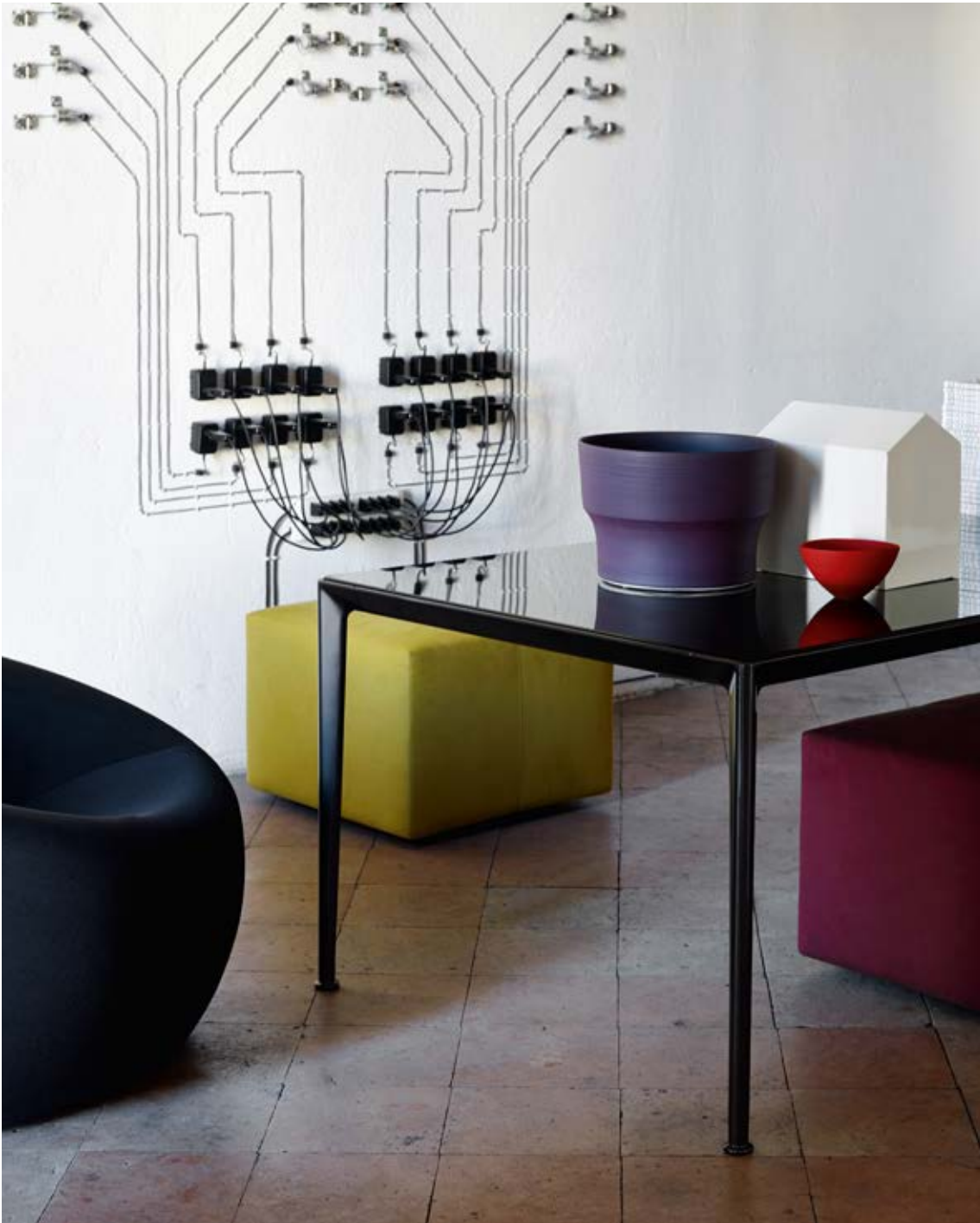
Mirto Indoor table_tavolo Serie UP 2000_UP1 small armchair_poltrona P60 ottoman_pouf