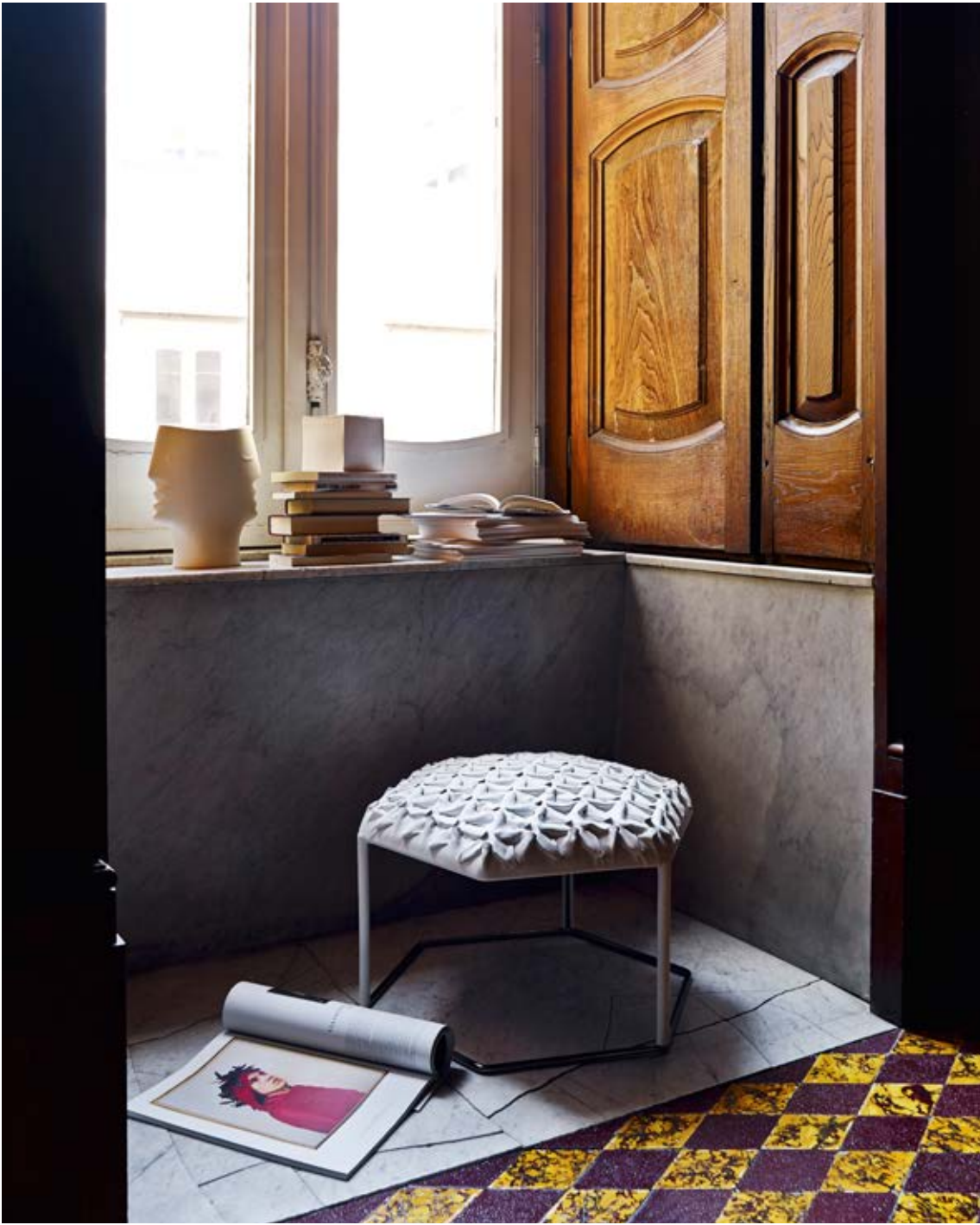
Hive small tables and ottoman_tavolini e pouf Tobî-Ishi table_tavolo Suavis carpet_tappeto