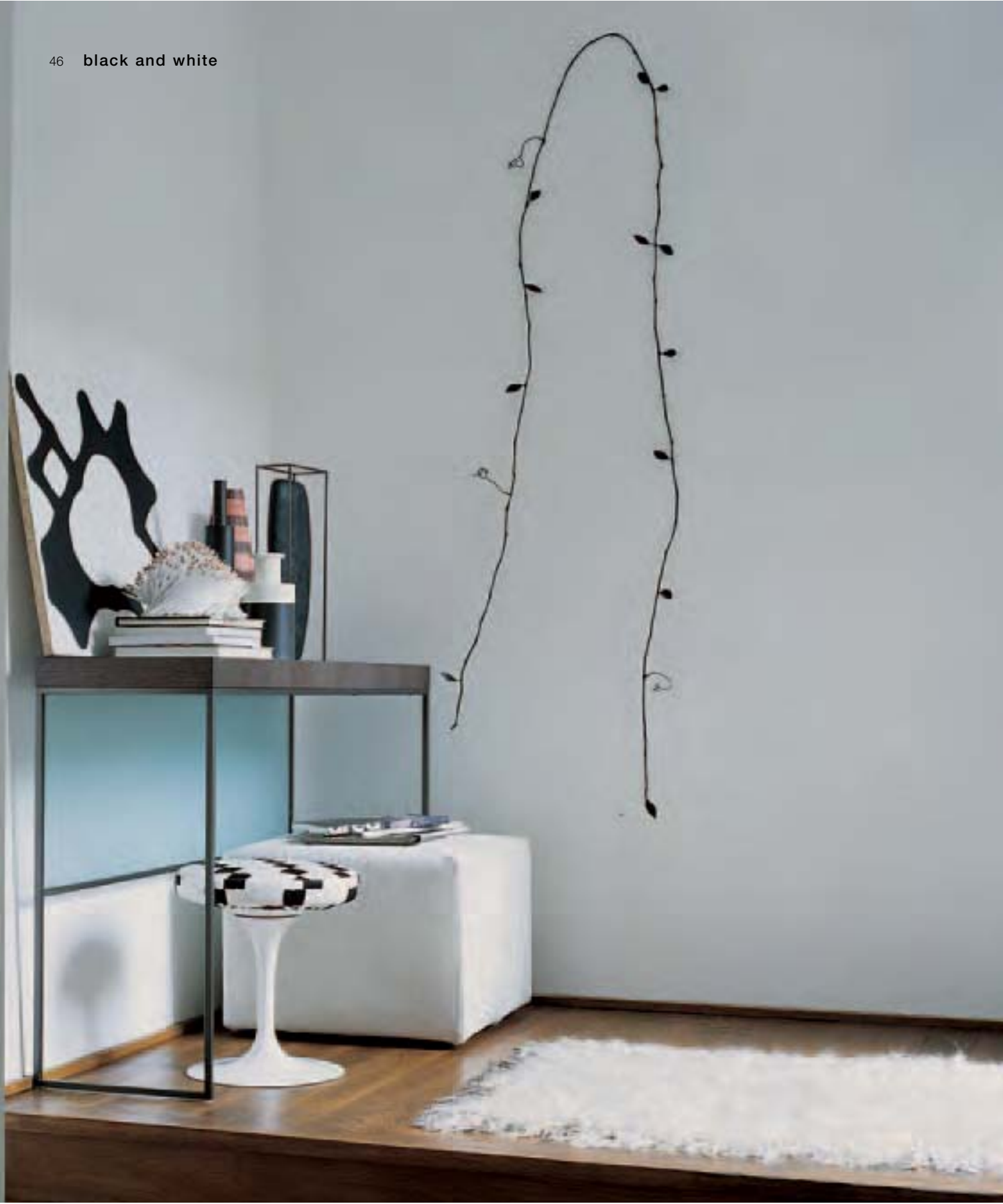
APTA 2029 consolle, console, console, Konsole