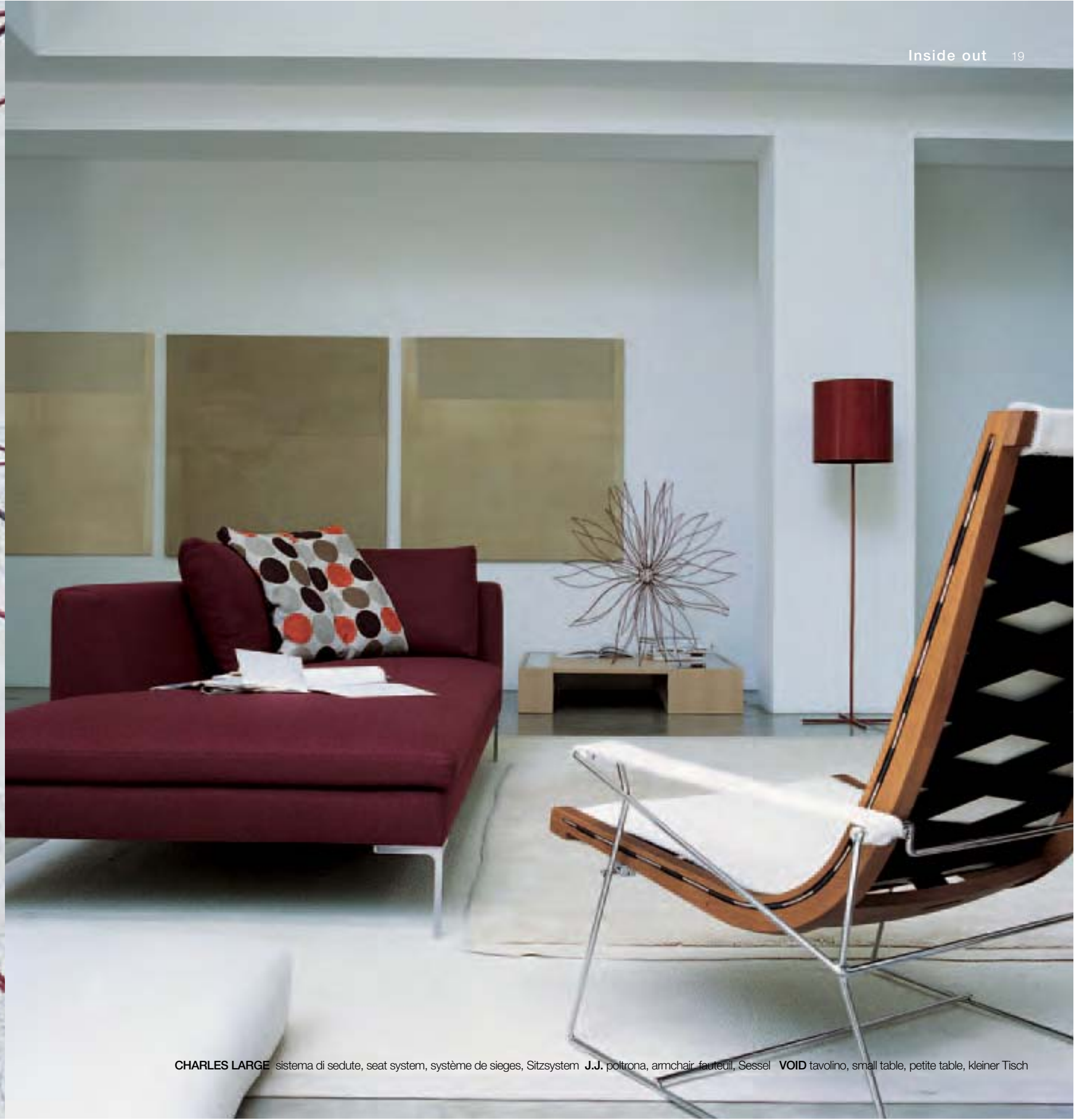
CHARLES LARGE sistema di sedute, seat system, système de sieges, Sitzsystem J.J. poltrona, armchair, fauteuil, Sessel VOID tavolino, small table, petite table, kleiner Tisch