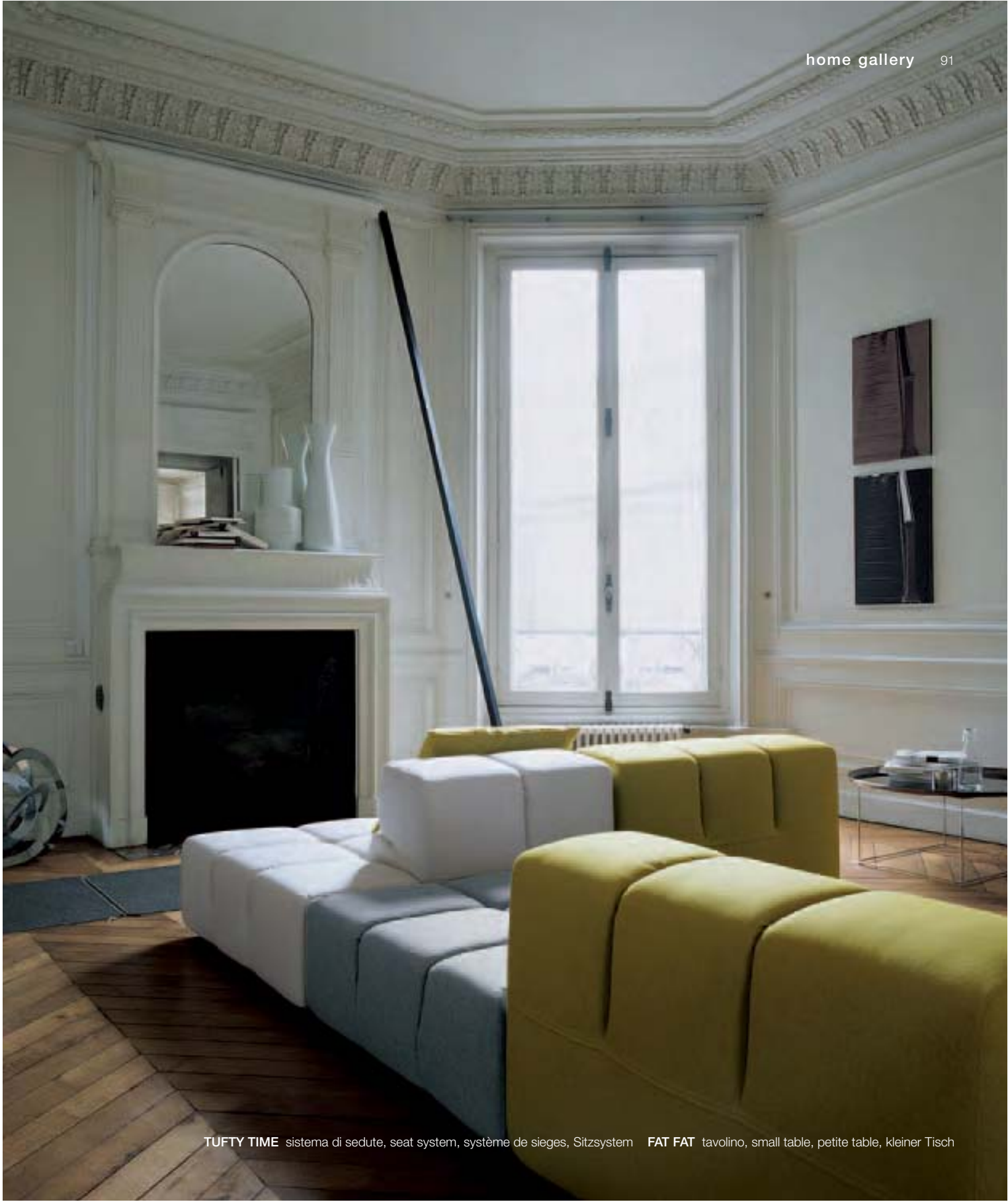
TUFTY TIME sistema di sedute, seat system, système de sieges, Sitzsystem FAT FAT tavolino, small table, petite table, kleiner Tisch