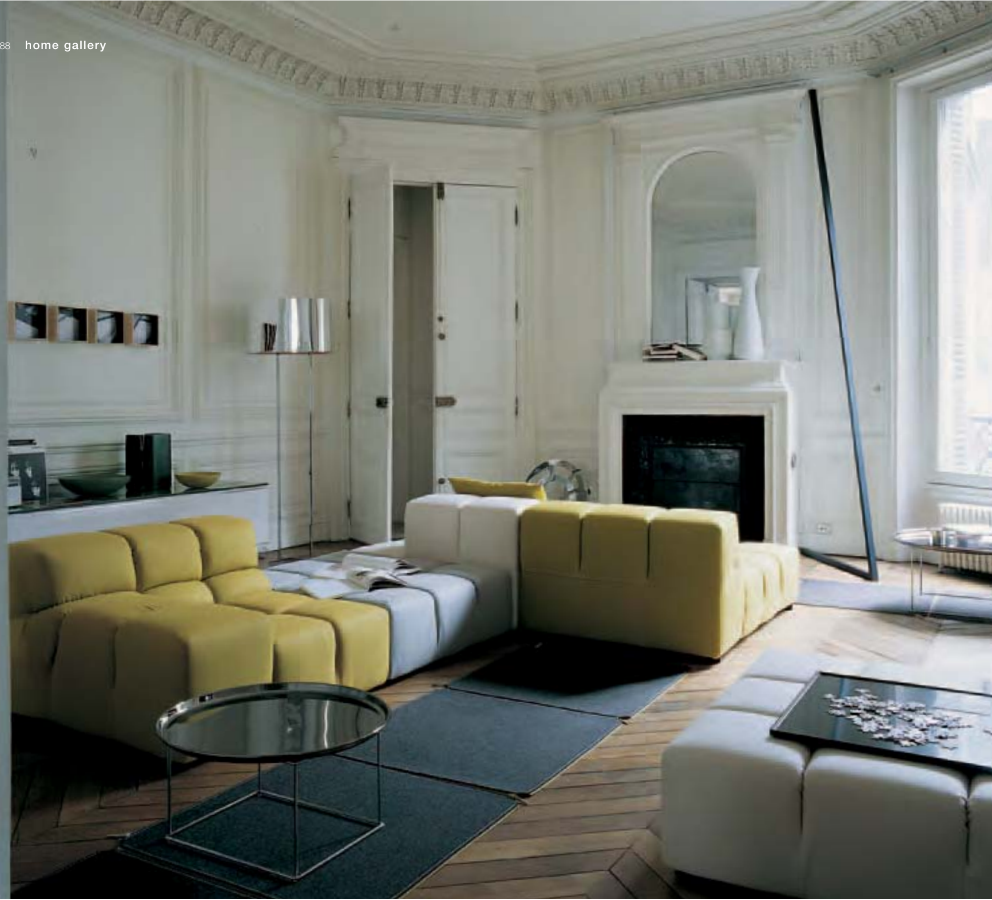
TUFTY TIME sistema di sedute, seat system, système de sieges, Sitzsystem FAT FAT tavolino, small table, petite table, kleiner Tisch DELTA FLOOR lampada, lamp, lampe, Lampe