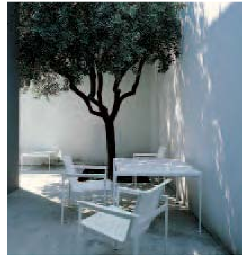
1966 COLLECTION mobili per esterno, outdoor furniture, meubles d'extérieur, Gartenmöbel