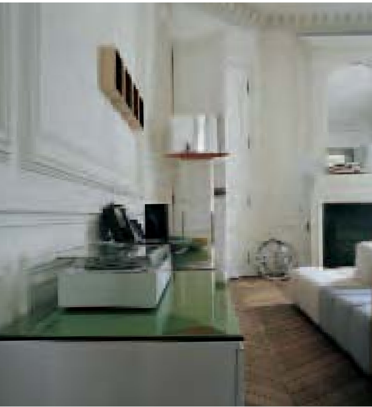
PAB '05 contenitore, storage unit, conteneur, Behälter lampada, lamp, lampe, Lampe