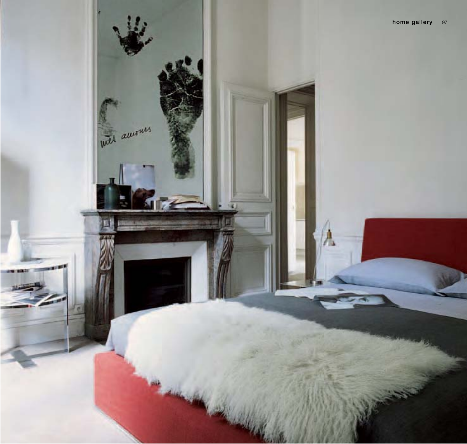
MARCEL letto, bed, lit, Bett EILEEN tavolino, small table, petite table, kleiner Tisch