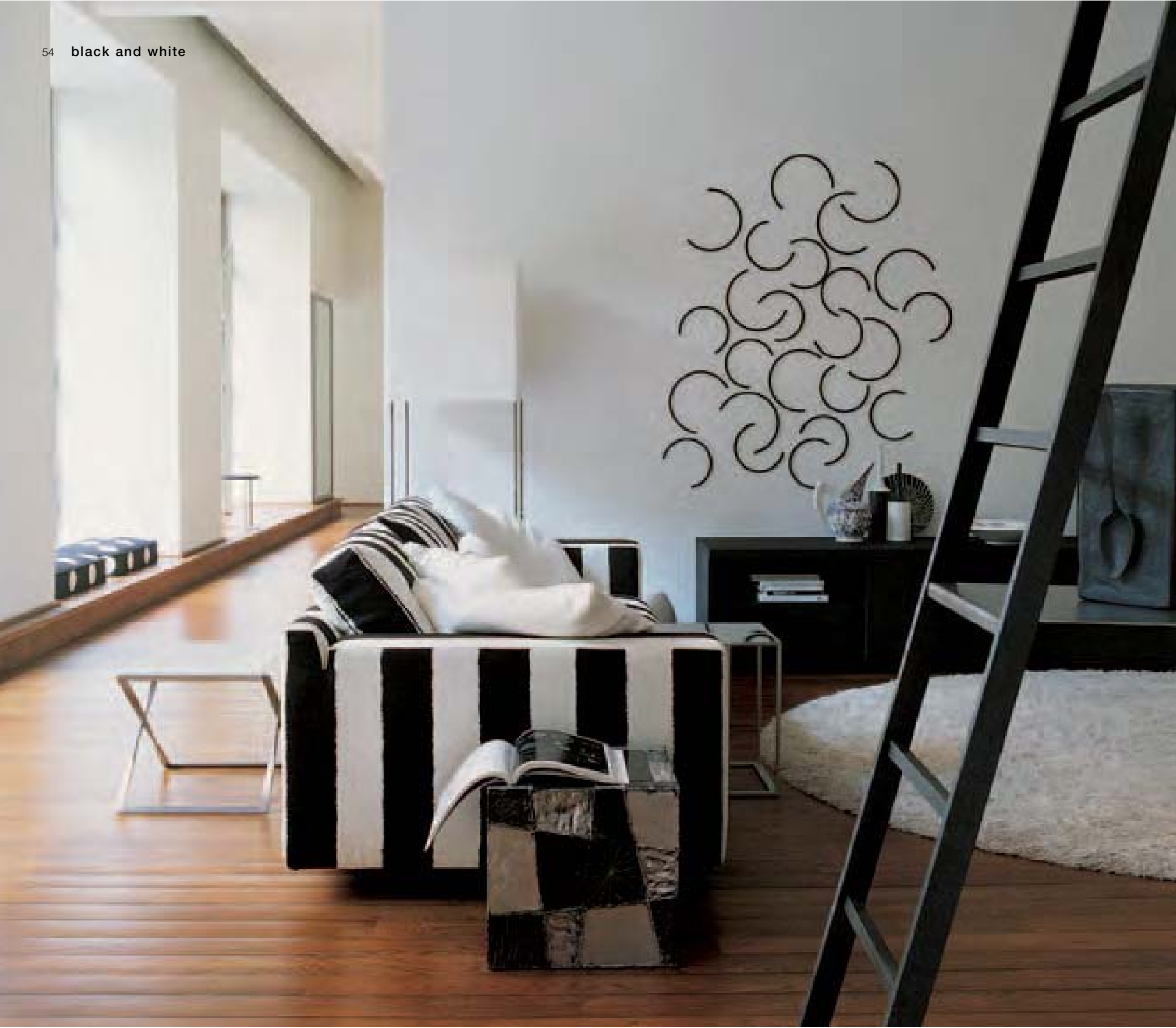
APTA 2300 divano, sofa, canapè, Sofa AC COLLECTION ACCR1 contenitore, storage unit, conteneur, Behälter SIMPLICE SMTM3 tavolino, small table, petite table, kleiner Tisch CUBIK 180 lampada, lamp, lampe, Lampe