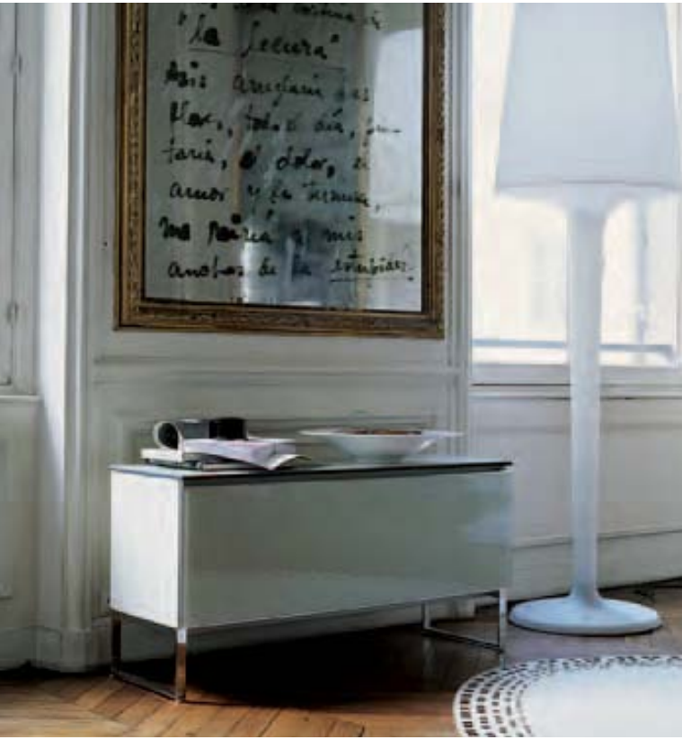
PAB '05 contenitore, storage unit, conteneur, Behälter HAIKUS 75 piatto centrotavola, centerpiece plate, plateau centre de table, Zierteller