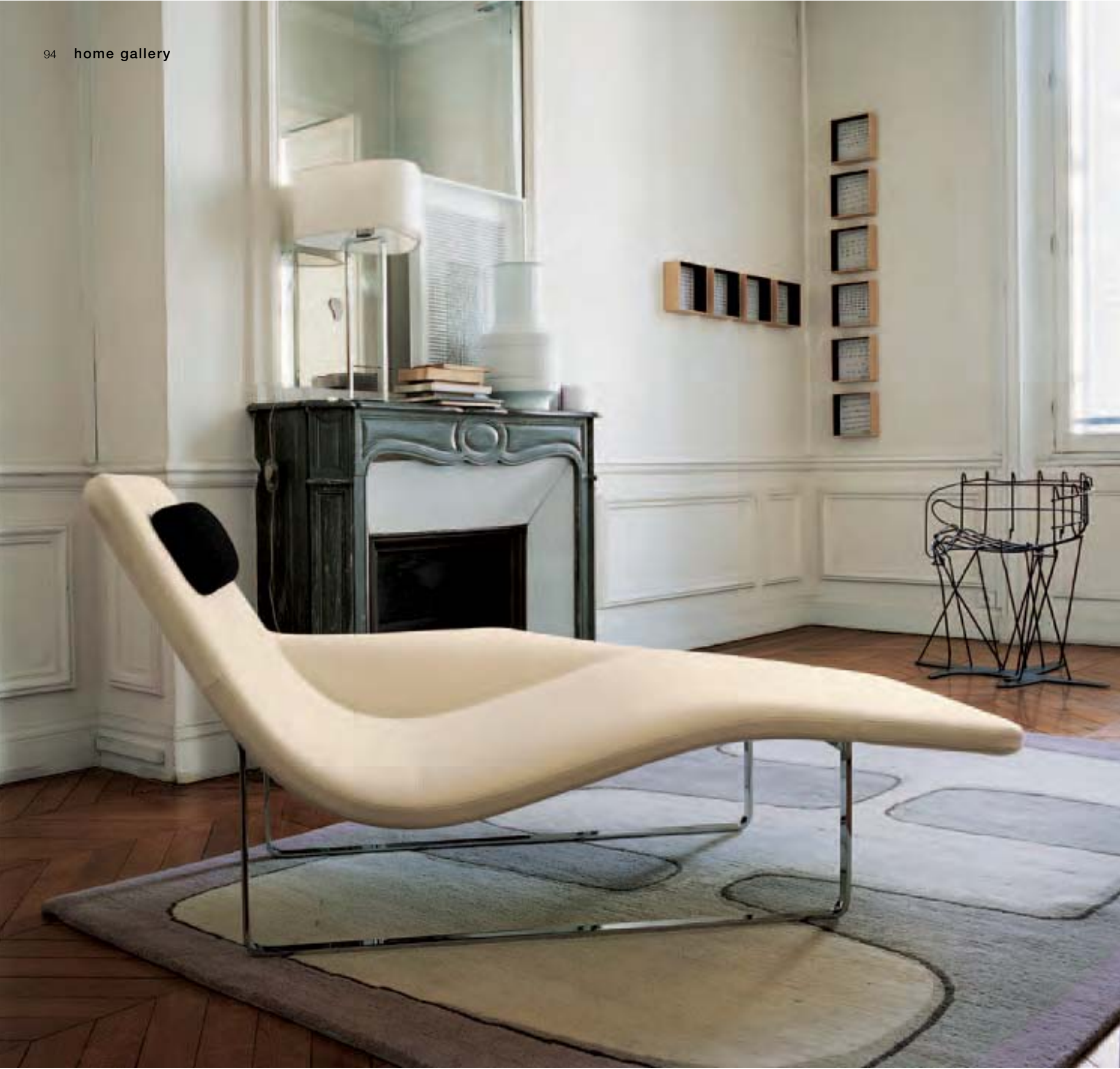
LANDSCAPE '05 chaise longue DELTA TABLE lampada, lamp, lampe, Lampe