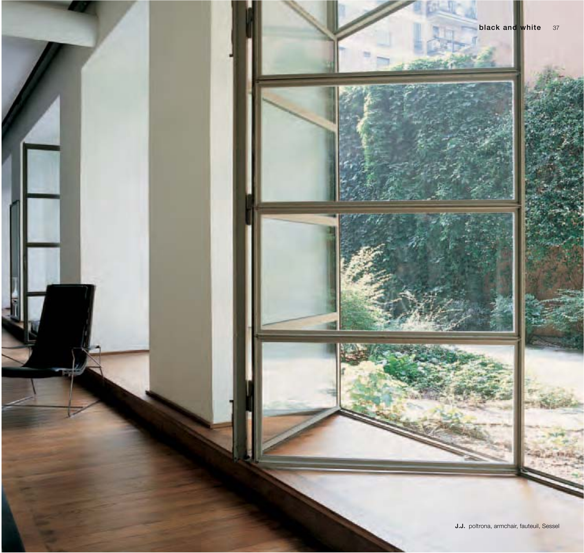
J.J. poltrona, armchair, fauteuil, Sessel