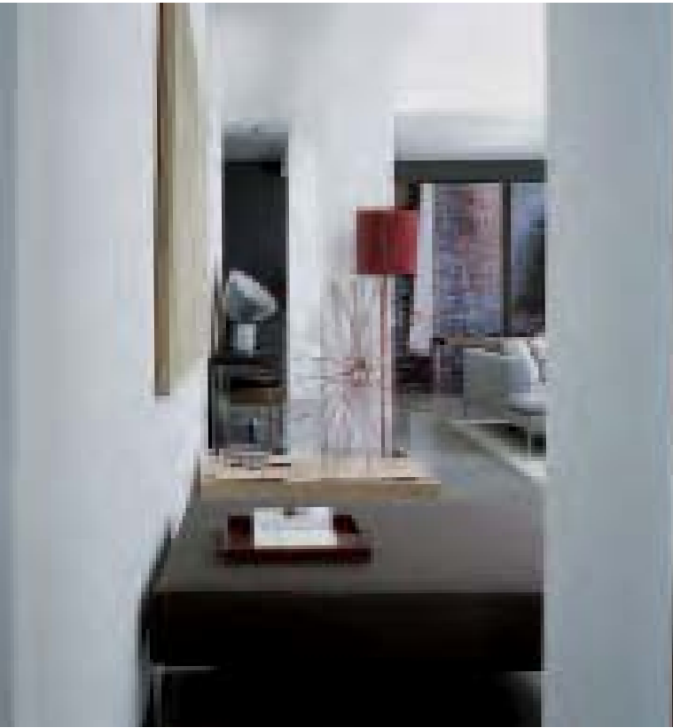
CHARLES pouf, ottoman, pouf, Pouff VOID tavolino, small table, petite table, kleiner Tisch