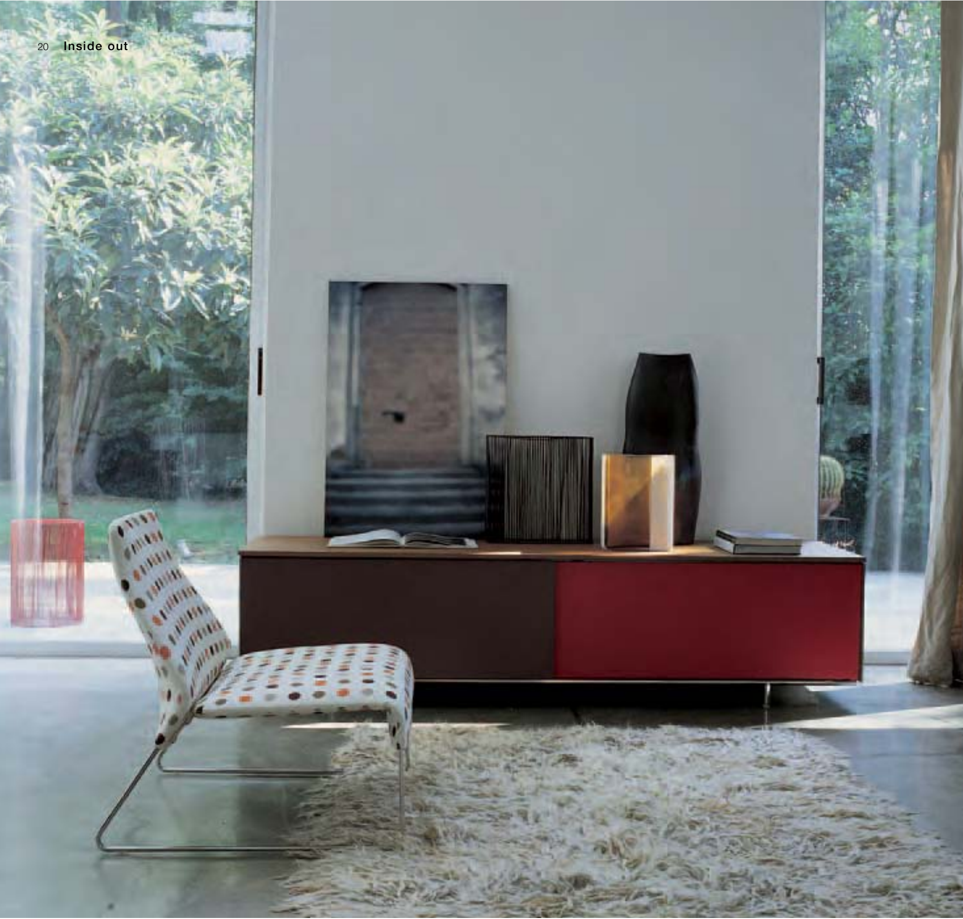
DOMUS '00 contenitore, storage unit, conteneur, Behälter kleiner Sessel LAZY '05 poltroncina, small armchair, petite fauteuil, SWIMMING POOL vaso, vase, vase, Vase