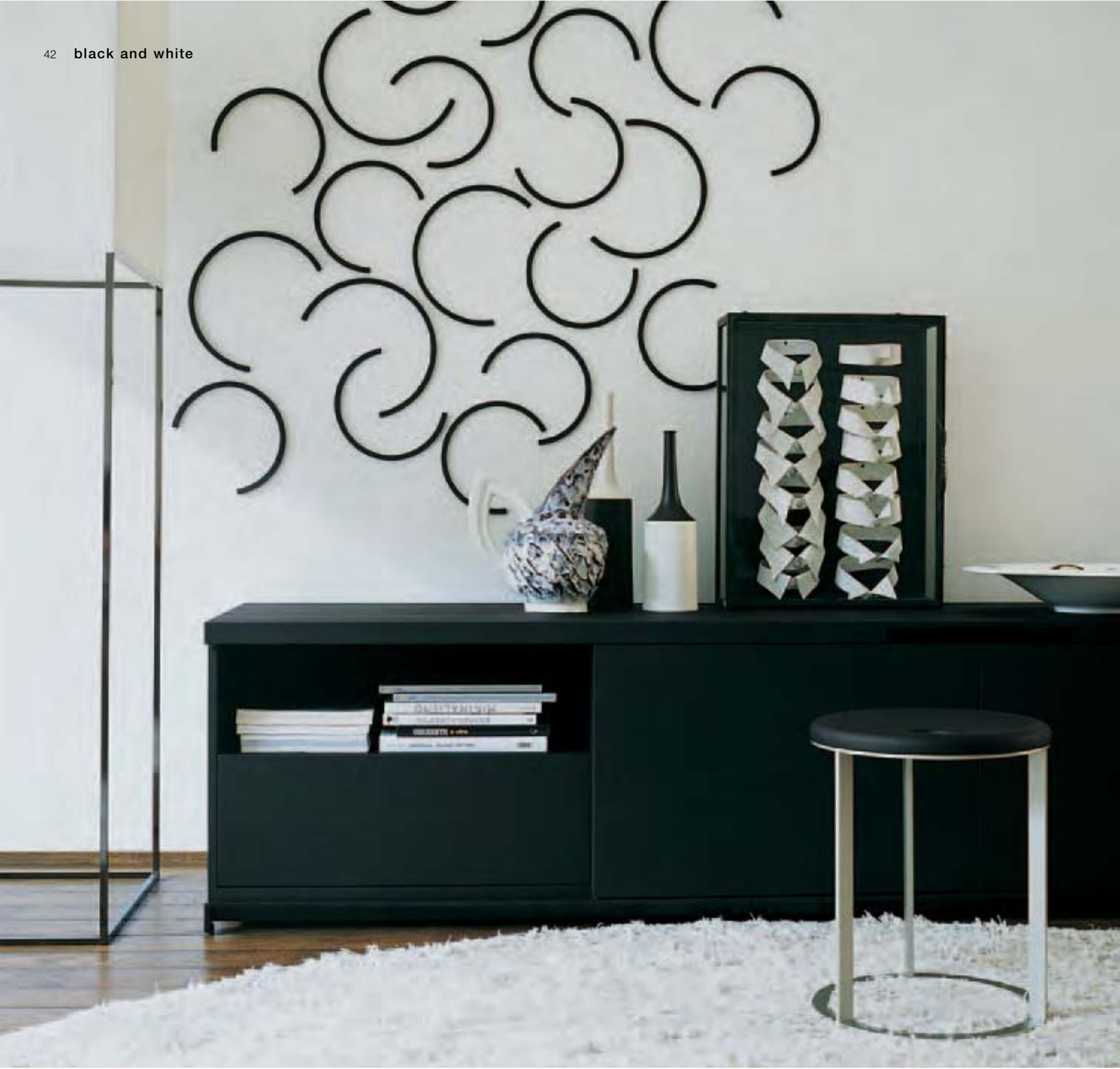
AC COLLECTION ACCR1 contenitore, storage unit, conteneur, Behälter SIMPLICE SMPT3 tavolino, small table, petite table, kleiner Tisch CUBIK 180 lampada, lamp, lampe, Lampe HAIKUS 75 piatto centrotavola, centerpiece plate, plateau centre de table, Zierteller