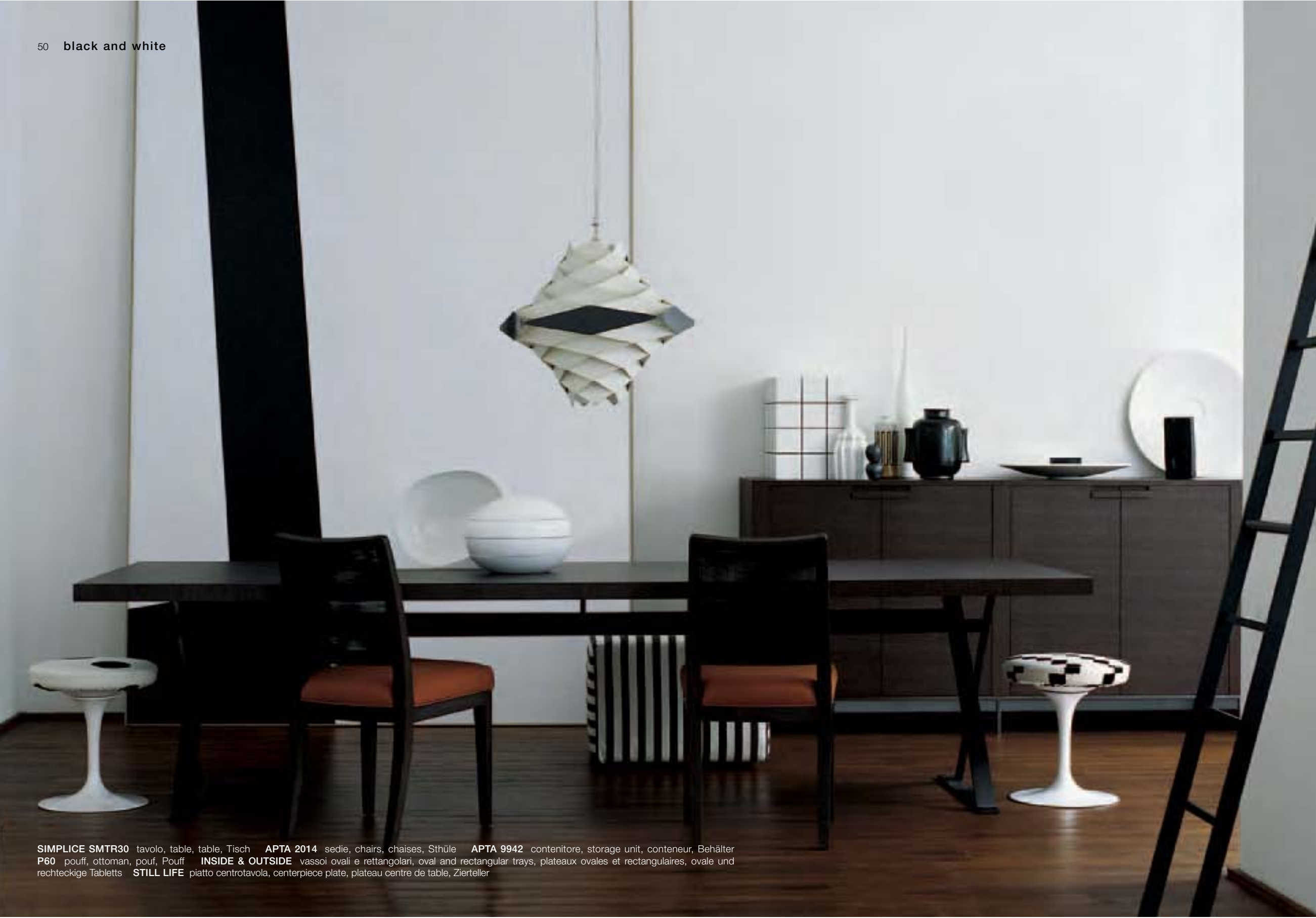
SIMPLICE SMTR30 tavolo, table, table, Tisch APTA 2014 sedie, chairs, chaises, Stühle APTA 9942 contenitore, storage unit, conteneur, Behälter P60 pouff, ottoman, pouf, Pouff INSIDE & OUTSIDE vassoi ovali e rettangolari, oval and rectangular trays, plateaux ovales et rectangulaires, ovale und rechteckige Tablettts STILL LIFE piatto centrotavola, centerpiece plate, plateau centre de table, Zierteller