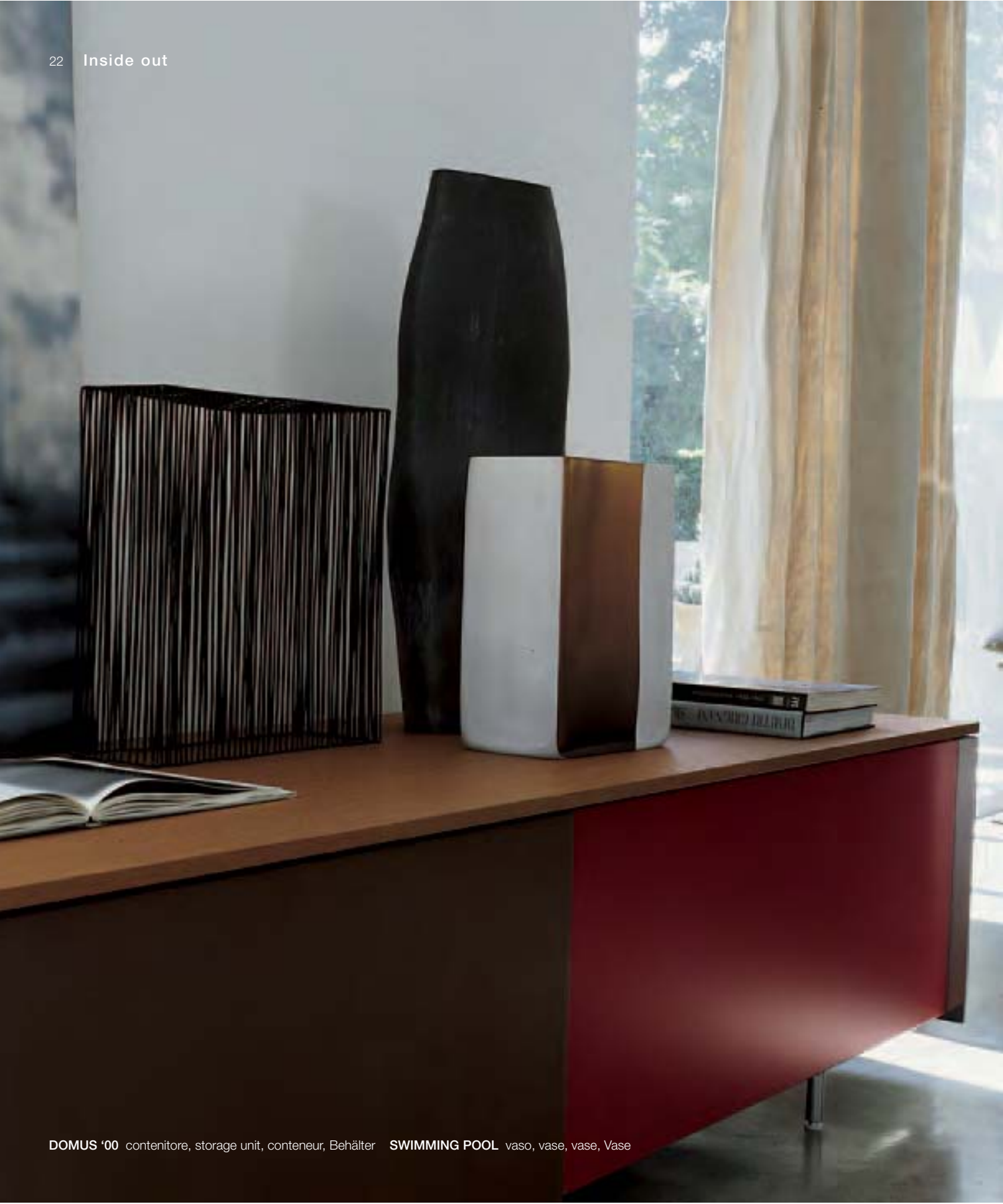
DOMUS '00 contenitore, storage unit, conteneur, Behälter SWIMMING POOL vaso, vase, vase, Vase