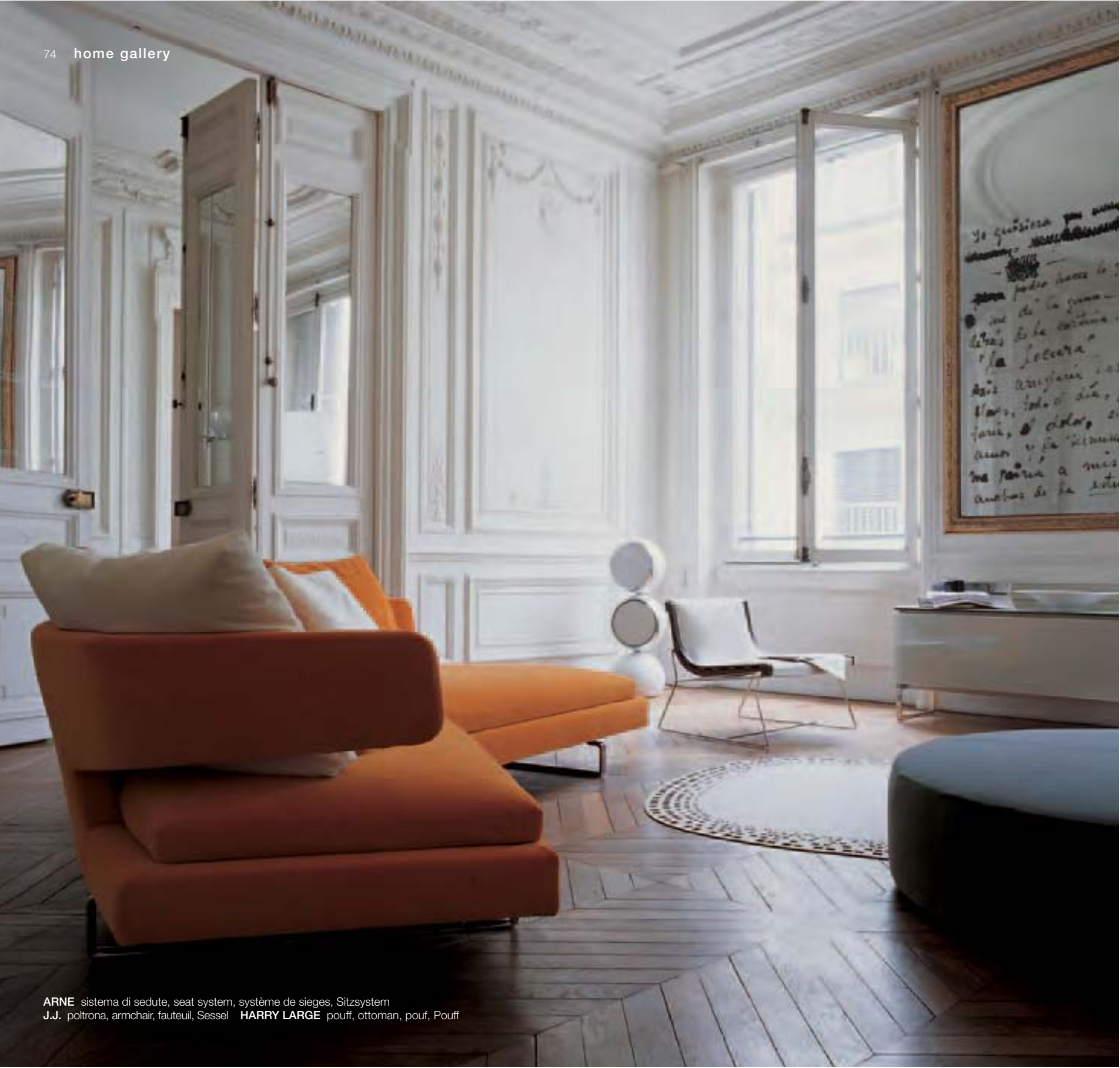
ARNE sistema di sedute, seat system, système de sieges, Sitzsystem J.J. poltrona, armchair, fauteuil, Sessel HARRY LARGE pouff, ottoman, pouf, Pouff