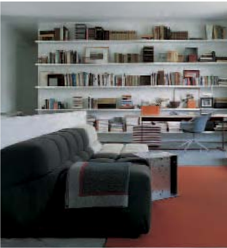
TUFTY TIME sistema di sedute, seat system, système de sieges, Sitzsystem DIGITABLE tavolino, small table, petite table, kleiner Tisch IUTA sedia, chair, chaise, Sthul EILEEN tavolo-scrrittoio, writing desk, petit bureau, Schreibtisch