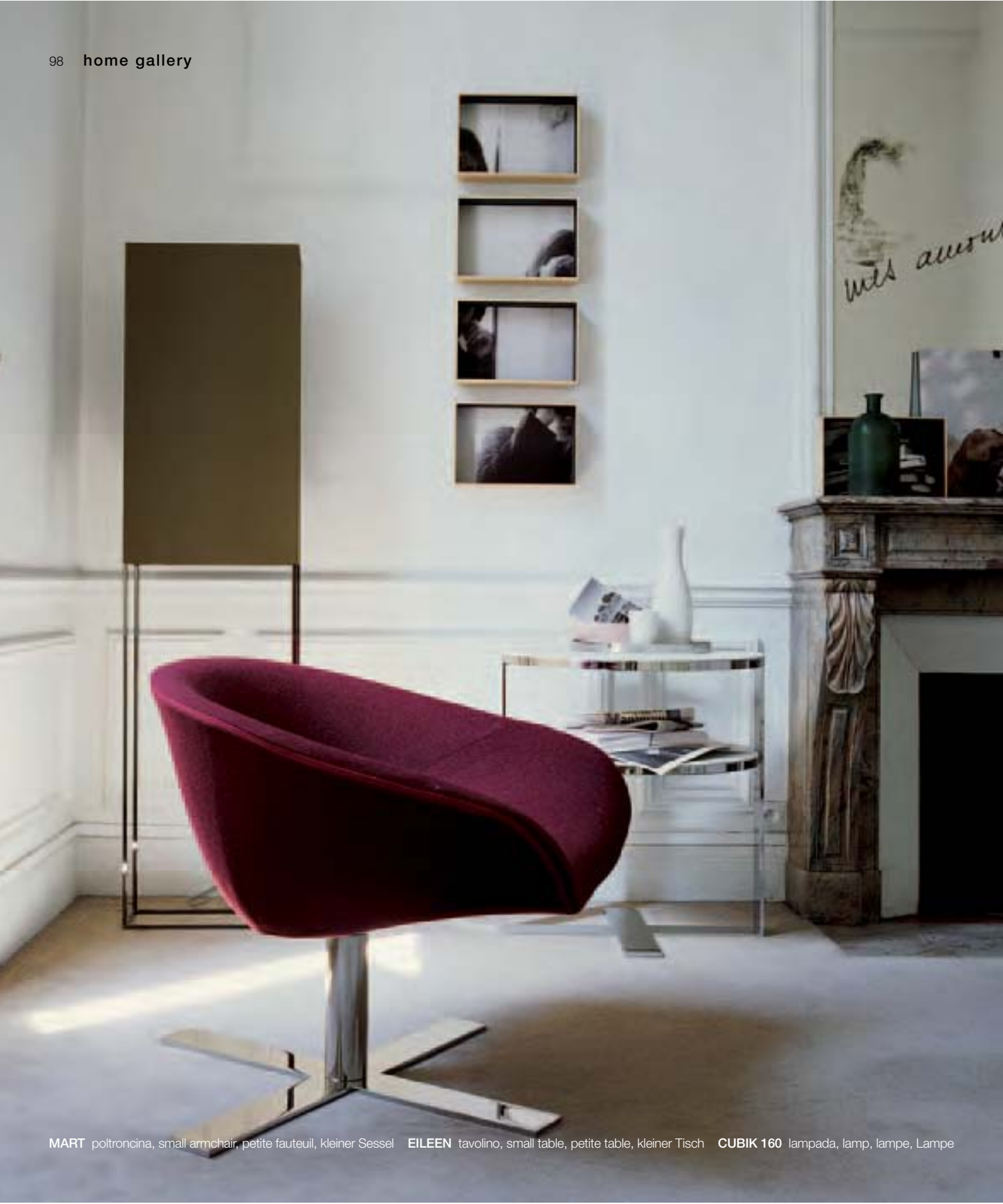
MART poltroncina, small armchair, petite fauteuil, kleiner Sessel EILEEN tavolino, small table, petite table, kleiner Tisch CUBIK 160 lampada, lamp, lampe, Lampe