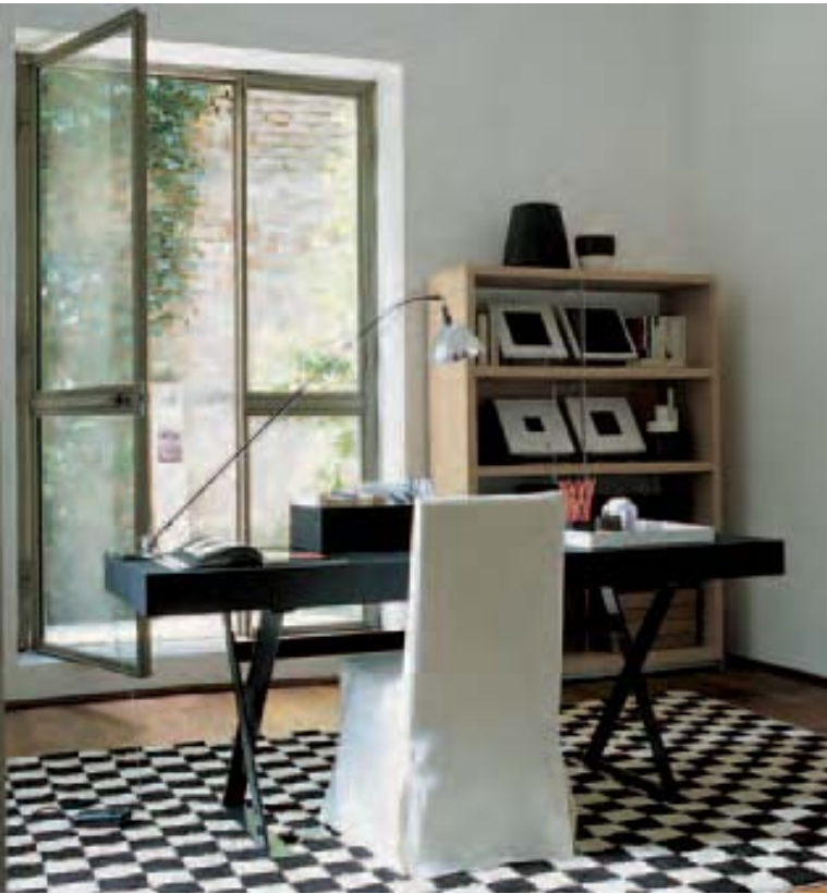
SIMPLICE SMSCR scrittoio, writing desk, bureau, Schreibtisch SIMPLICE SMS42 sedia, chair, chaise, Stuhl AC COLLECTION ACLG1 contenitore, storage unit, conteneur, Behälter