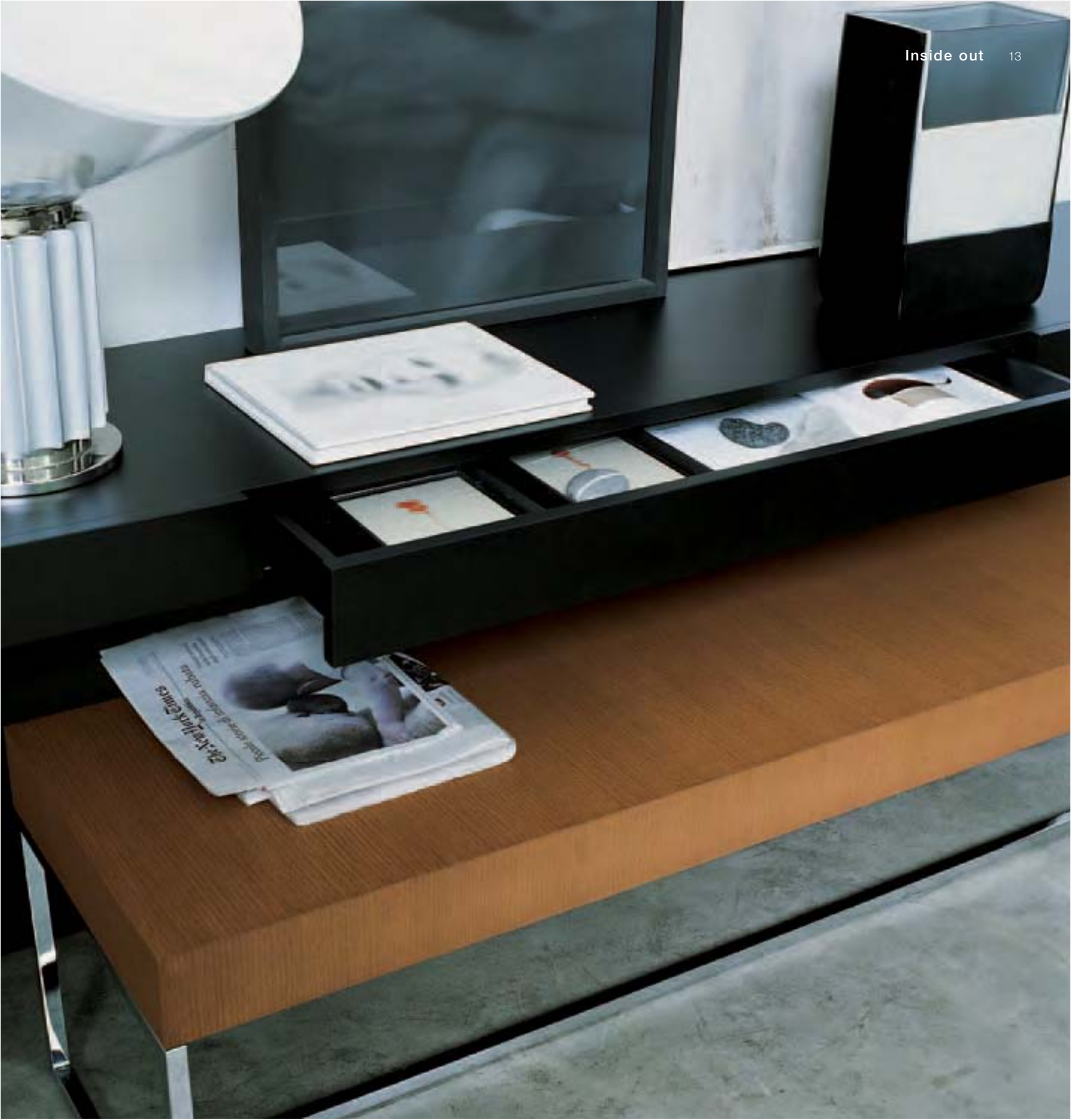
ATHOS '05 consolle e panca, console and bench, console et banc, Konsole und Bank SUNSET vaso, vase, vase, Vase