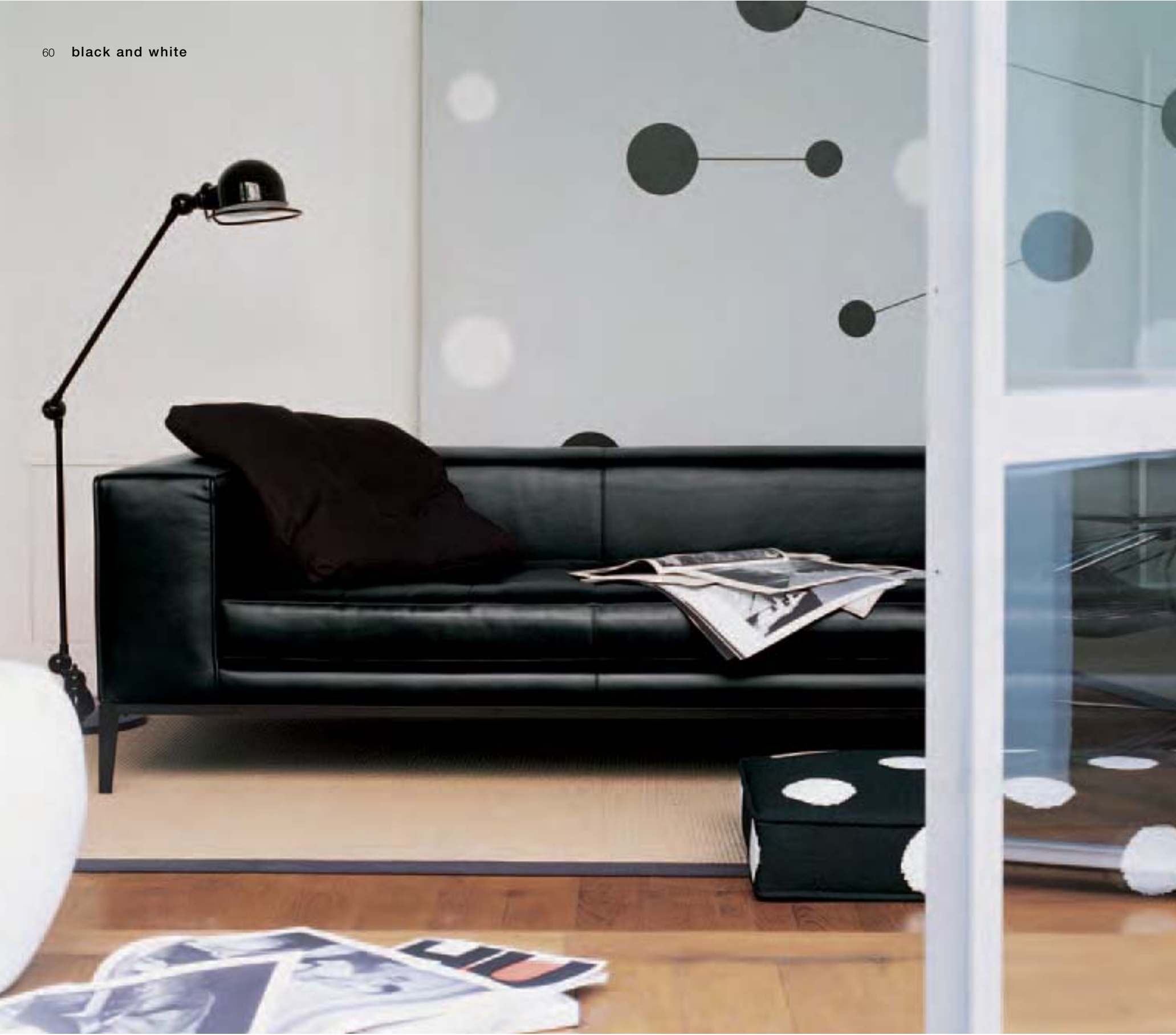
SIMPLICE SMD242/1 divano, sofa, canapè, Sofa