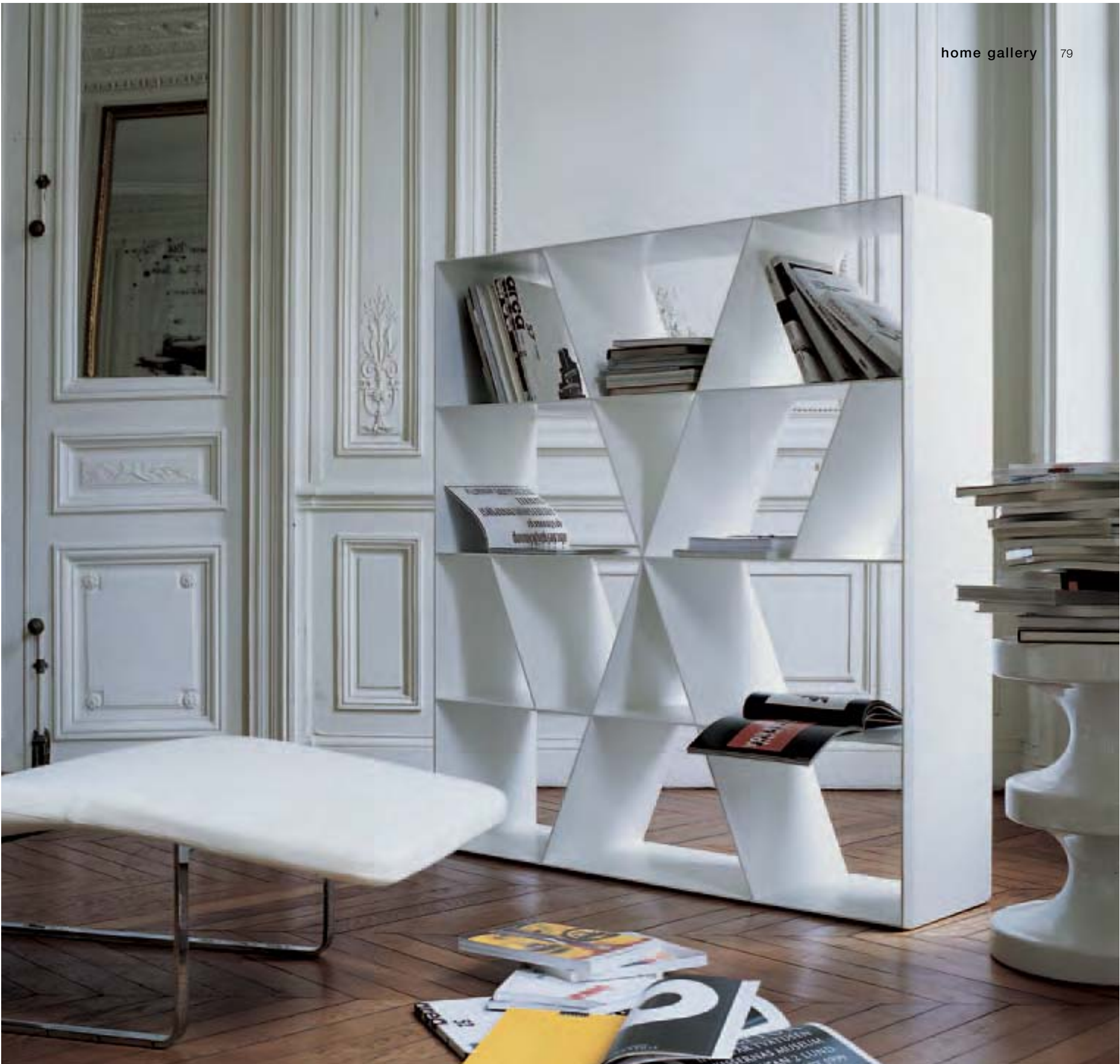
SHELF X libreria, bookcase, bibliothèque, Bücherregal LANDSCAPE '05 chaise longue