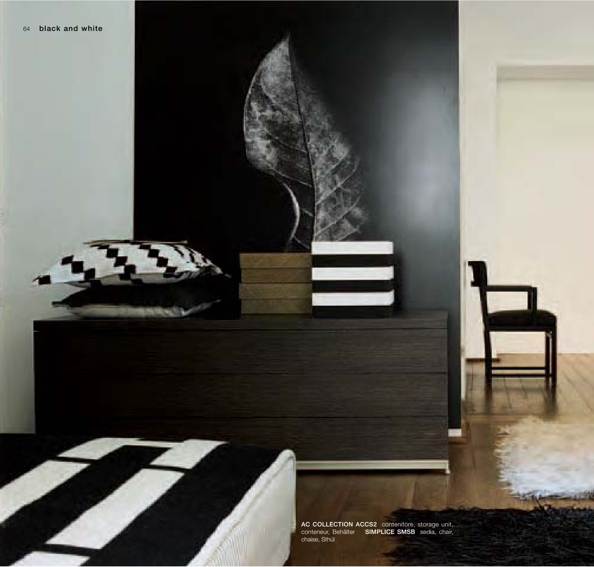
AC COLLECTION ACCS2 contenitore, storage unit, conteneur, Behälter SIMPLICE SMSB sedia, chair, chaise, Stuhl