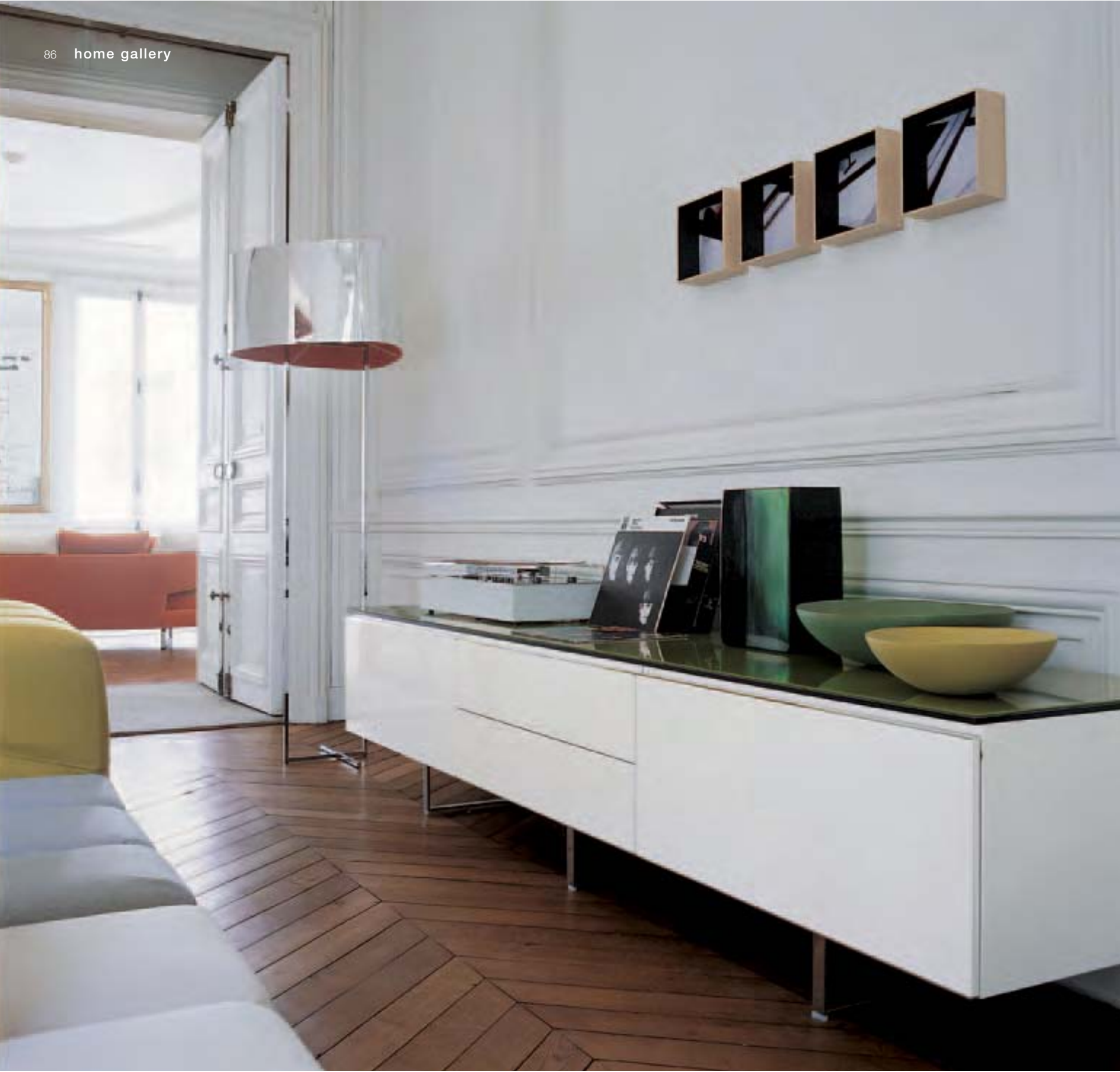
PAB '05 contenitore, storage unit, conteneur, Behälter lampada, lamp, lampe, Lampe