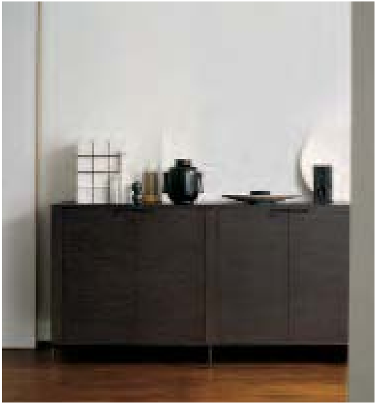
APT 9942 contenitore, storage unit, conteneur, Behälter STILL LIFE piatto centrotavola, centerpiece plate, plateau centre de table, Zierteller