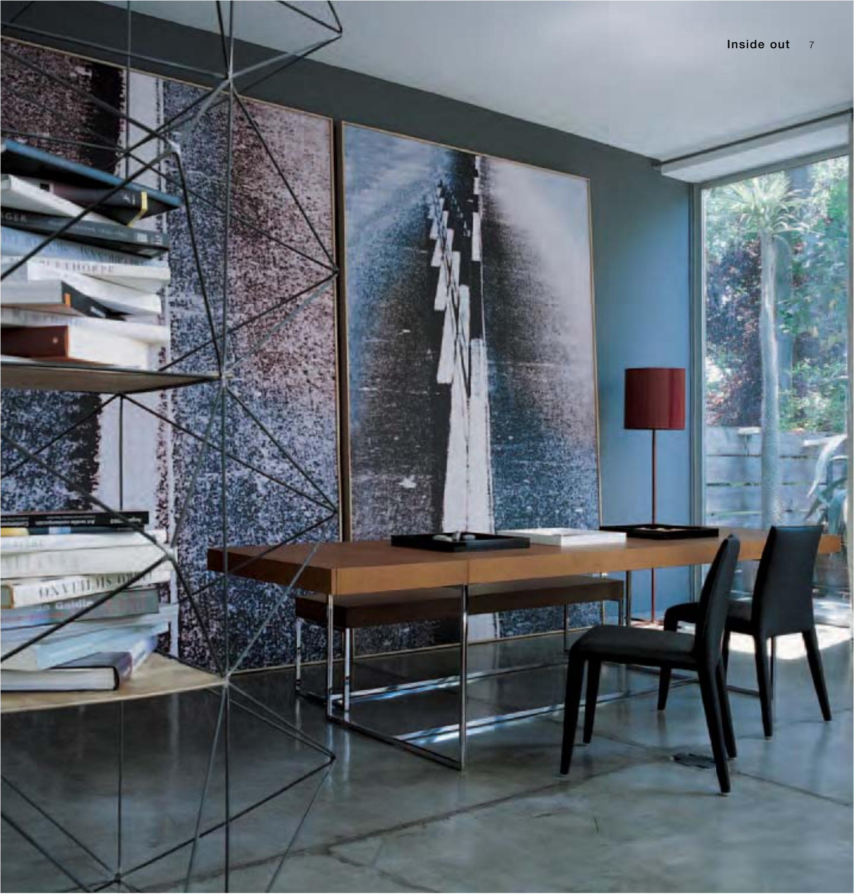
ATHOS '05 tavolo e panca, table and bench, table et banc, Tisch und Bank VOL AU VENT sedie, chairs, chaises, Sthüle