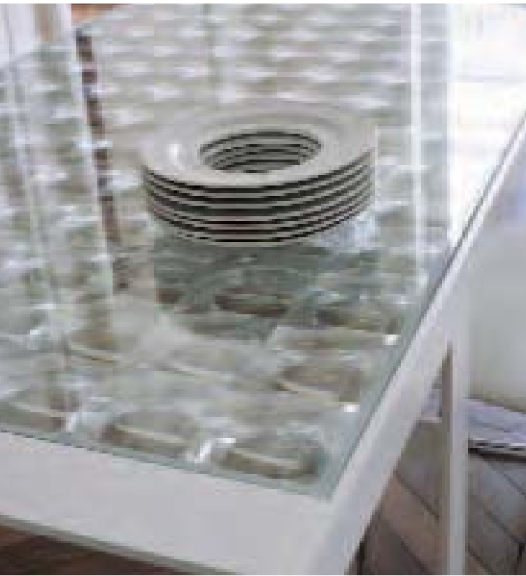
LENS tavolo, table, table, Tisch LAZY '05 sedie, chairs, chaises, Stühle