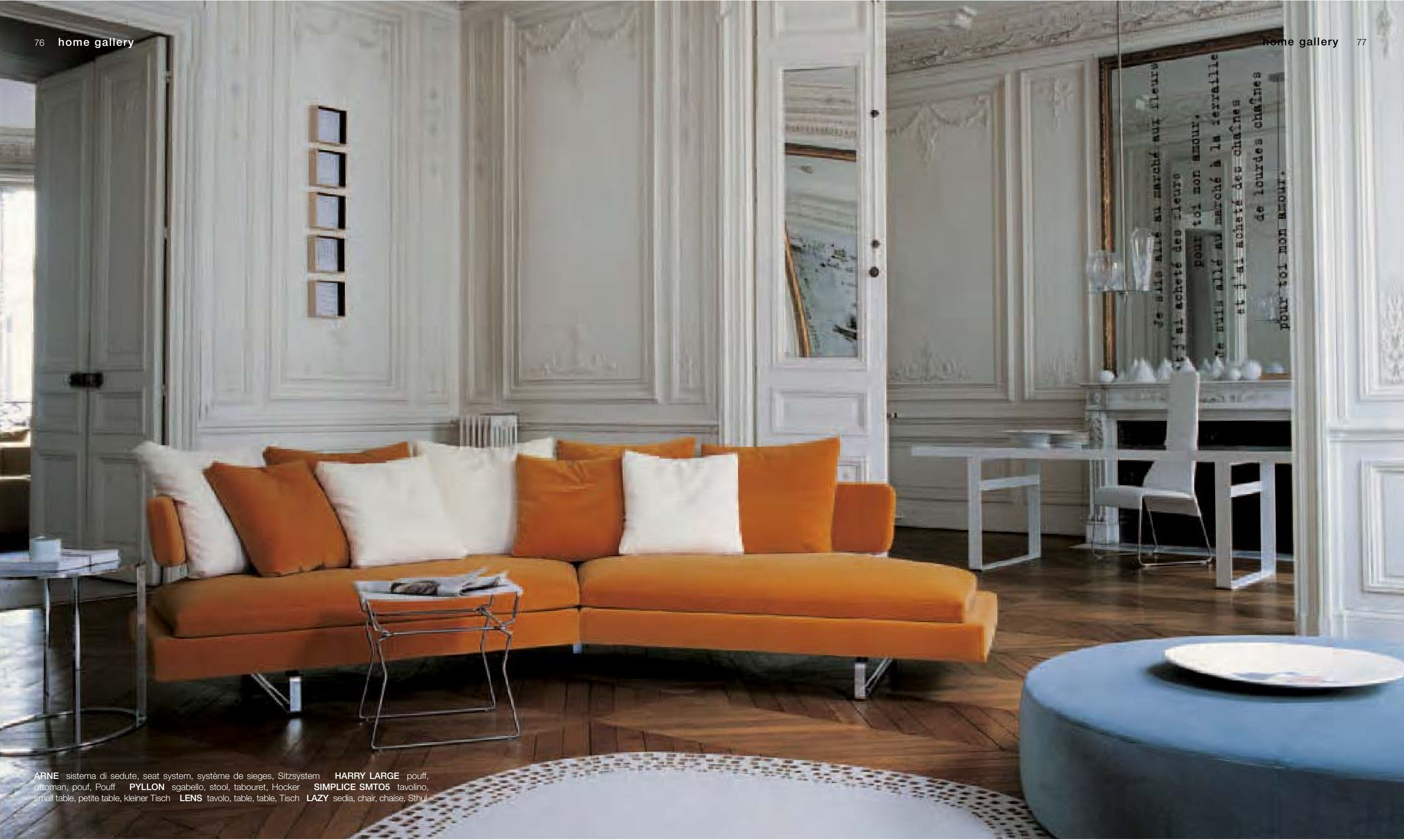
ARNE sistema di sedute, seat system, système de sièges, Sitzsystem HARRY LARGE pouff, ottoman, pouf, Pouff PYLLON sgabello, stool, tabouret, Hocker SIMPLICE SMT05 tavolino, small table, petite table, kleiner Tisch LENS tavolo, table, table, Tisch LAZY sedia, chair, chaise, Sthul