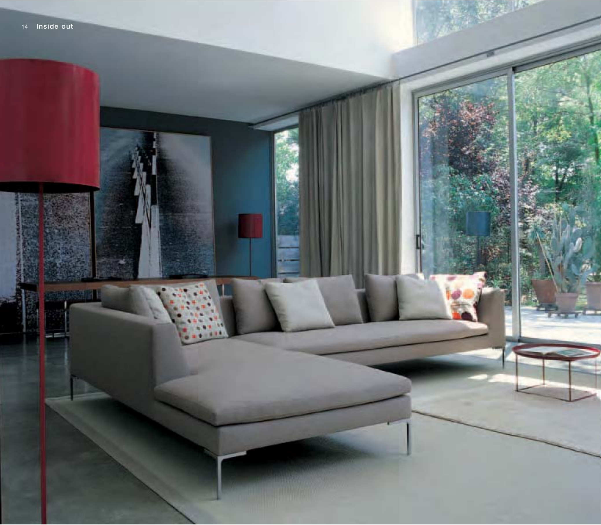
CHARLES LARGE sistema di sedute, seat system, système de sieges, Sitzsystem FAT FAT tavolino, small table, petite table, kleiner Tisch