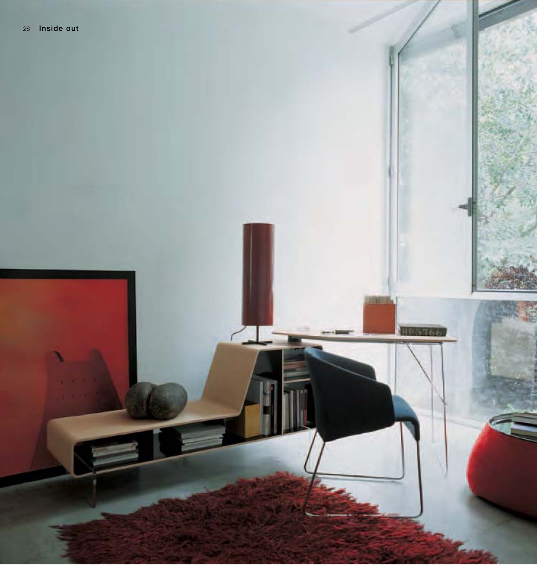
ARNE scrittoio-contenitore, writing desk-storage unit, bureau-conteneur, Schreibtisch-Behälter fauteuil, kleiner Sessel FAT FAT tavolino, small table, petite table, kleiner Tisch LAZY '05 poltroncina, small armchair, petite