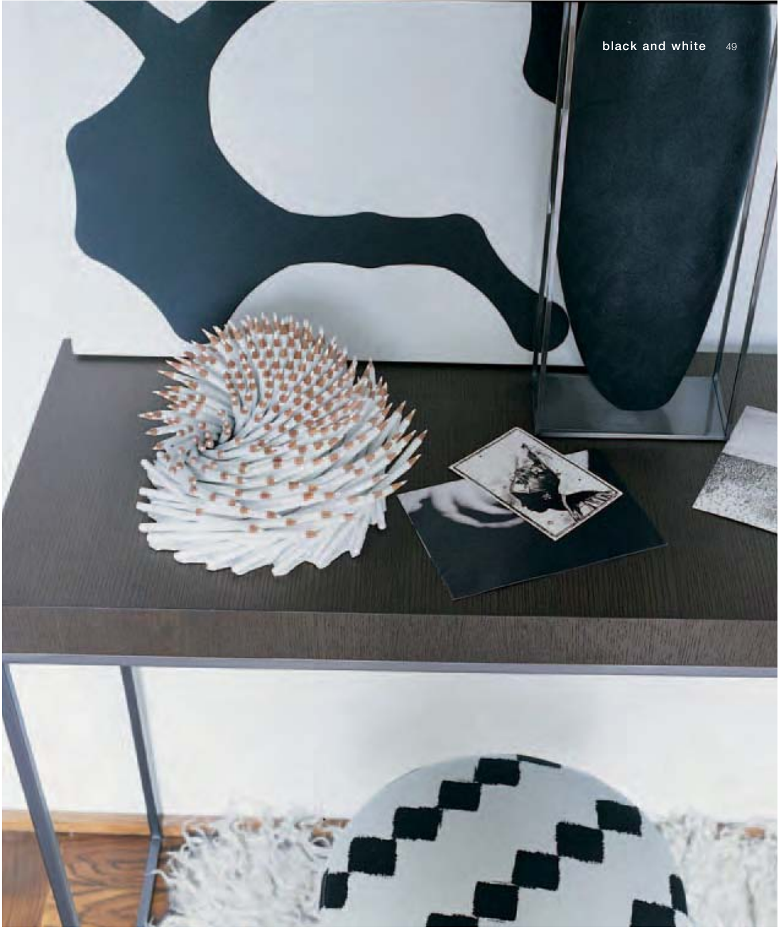
APTA 2029 consolle, console, console, Konsole OVERSCALE candela, candle, bougie, Kerze