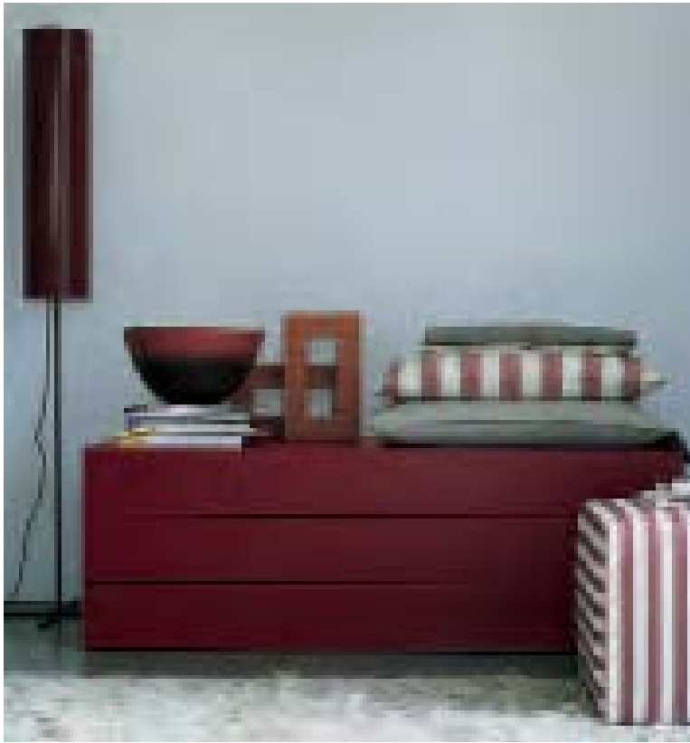
DOOR cassettone, chest of drawer, commode, Kommode PAB '05 panca, bench, banc, Bank