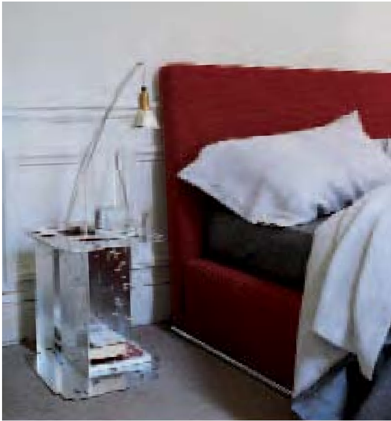
MARCEL letto, bed, lit, Bett DIGITABLE tavolino, small table, petite table, kleiner Tisch