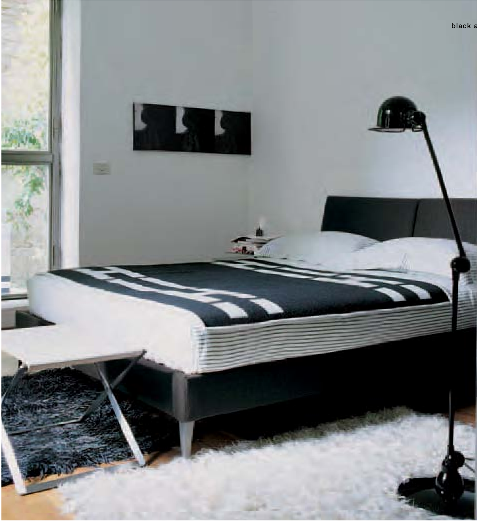
APTA 9745 letto sfoderabile, bed with removable cover, lit déhoussable, Bett mit abnehmbarem Bezug