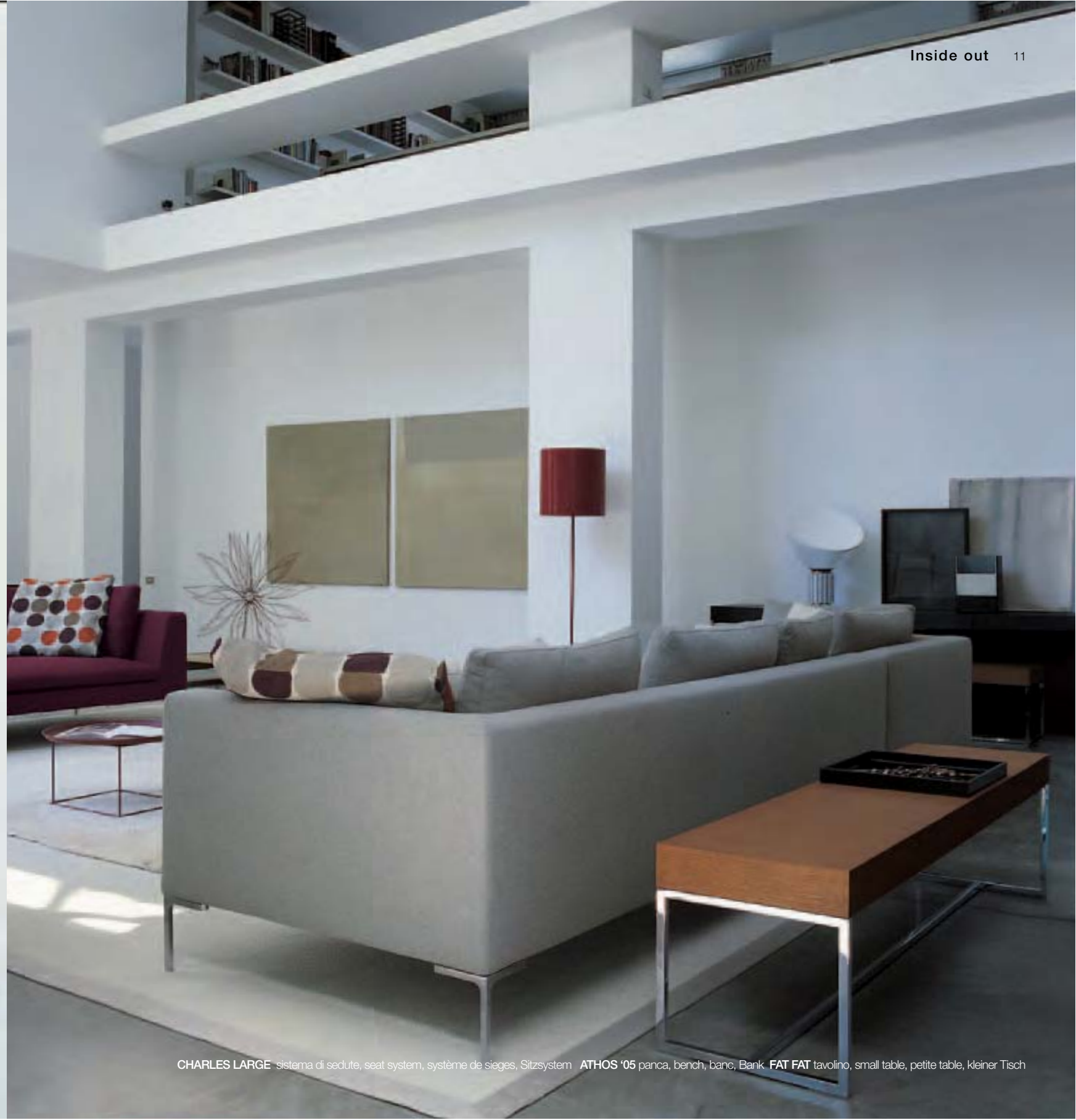
CHARLES LARGE sistema di sedute, seat system, système de sieges, Sitzsystem ATHOS '05 panca, bench, banc, Bank FAT FAT tavolino, small table, petite table, kleiner Tisch